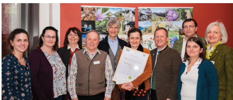
... im Naturpark Zirbitzkogel-Grebenzen

Herzliche Gratulation an die Preisträgerinnen und Preisträger!