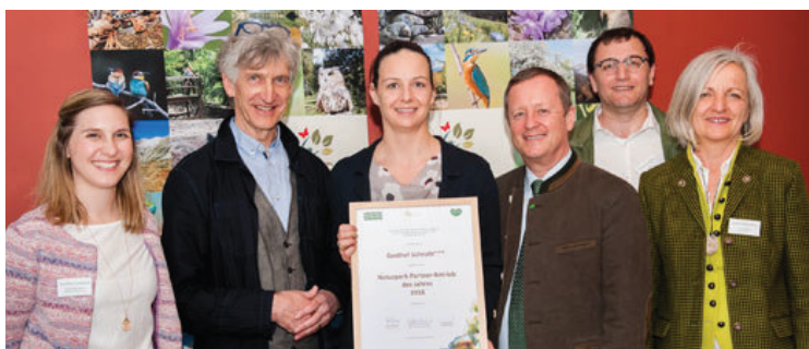
... im Naturpark Steirische Eisenwurzen