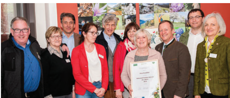
... im Naturpark Sölk-täler