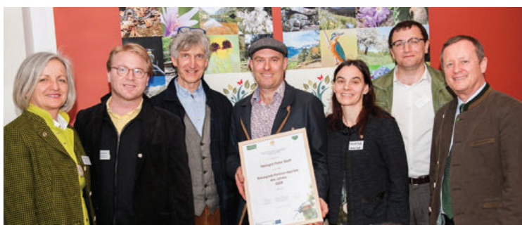
... im Naturpark Südsteiermark