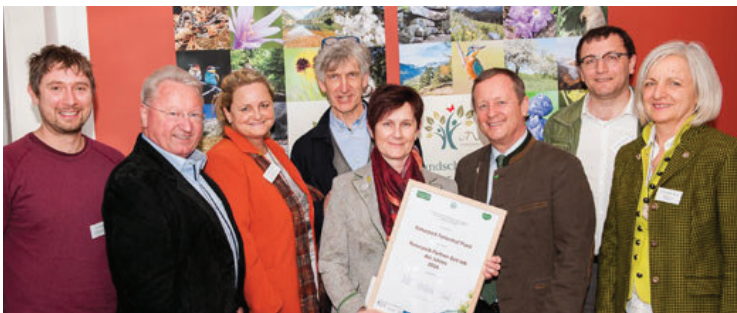
... im Naturpark Pöllauer Tal