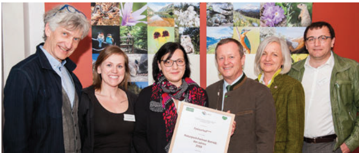
... im Naturpark Mürzer Oberland