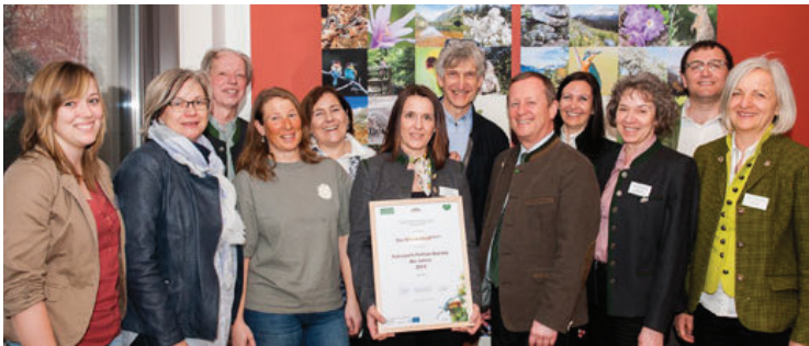
... im Naturpark Almenland