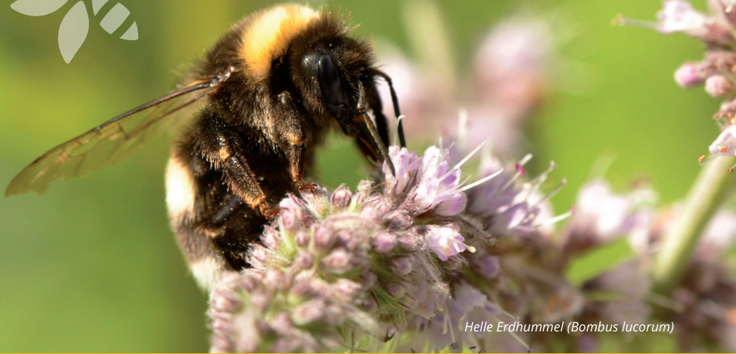
Helle Erdhummel (Bombus lucorum)