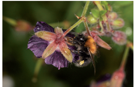
Foto unten: Baumhummel (Bombus hypnorum) auf Dunklem Storchschnabel