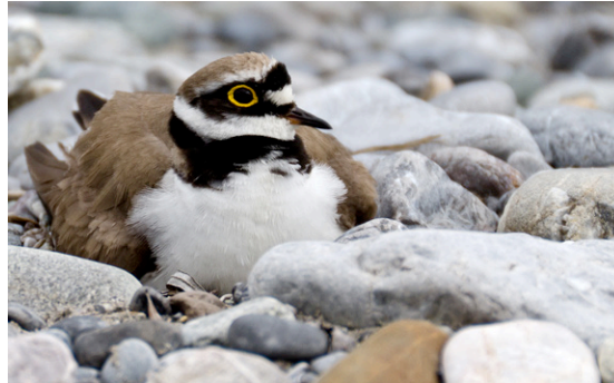
Die meisten der im Bestand gefährdeten Flussregenpfeifer gibt es österreichweit am Tiroler Lech. Hier finden sie noch offene Kiesbänke, die für Nahrungssuche und Brut lebensnotwendig sind.

Das Lechtal im Nordwesten Tirols ist einer der urtümlichsten und schönsten Landschaftsräume der Alpen. Der 2004 gegründete Naturpark liegt mit 24 Gemeinden und einer Gesamtfläche von rund 40 Quadratkilometern zur Gänze in den Nördlichen Kalkalpen und umfasst neben dem Talraum auch Teile der angrenzenden Bergmischwälder. Der Lech und seine Seitenzubringer sind die