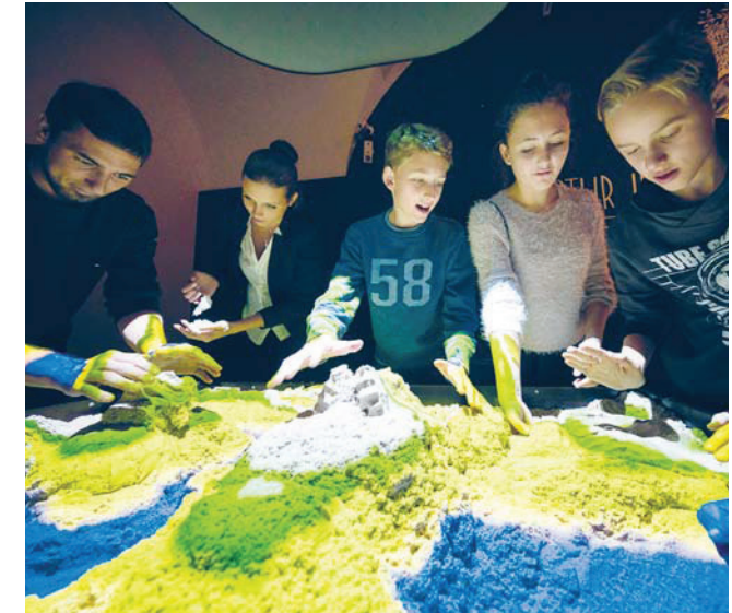
Spielerisch Berge, Wiesen, Seen und Flüsse formen

Mehr als jemals zuvor liegen wir in der Hand der Natur!