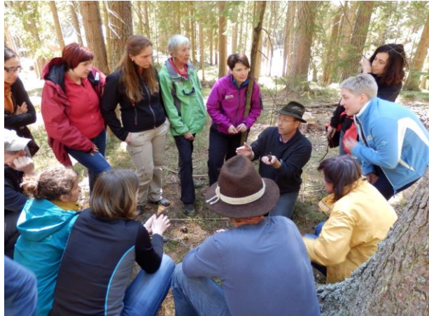
Der Wald als Lernort

Zunächst wurde, als zentrales Element, das Curriculum für den Schwerpunkt im Bachelorstudium Lehramt Primarstufe entwickelt. Dieses wurde Anfang 2018 vom Bildungsministerium bewilligt. Im zweiten Schritt wurde auf dieser Basis das Curriculum für den Hochschullehrgang ausgearbeitet und zur Bewilligung eingereicht. Daran anschließend entwickelten wir ein vertiefendes Masterstudium Lehramt Primarstufe mit Schwerpunkt Lernraum Natur. Dieses wurde mit den Partnerhochschulen und Partneruniversitäten im Entwicklungsverbund Süd-Ost abgestimmt und danach bewilligt.