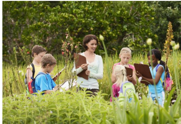
Unterricht im Freien

Ausgangspunkt dieser Initiative war ein 2015 gestartetes Projekt zur Unterstützung von Naturpark-Schulen. Das Burgenland hatte damals 20 Naturpark-Schulen, 15 Volksschulen und 5 (kleine) Neue Mittelschulen im ländlichen Raum. Das Projekt bot Fortbildung, Vernetzung und Schulentwicklungsberatung. Es wurde in Kooperation mit dem Regionalmanagement Burgenland (ARGE Naturparke Burgenland) entwickelt und durchgeführt, wurde gut angenommen und läuft mittlerweile sehr erfolgreich im fünften Jahr.