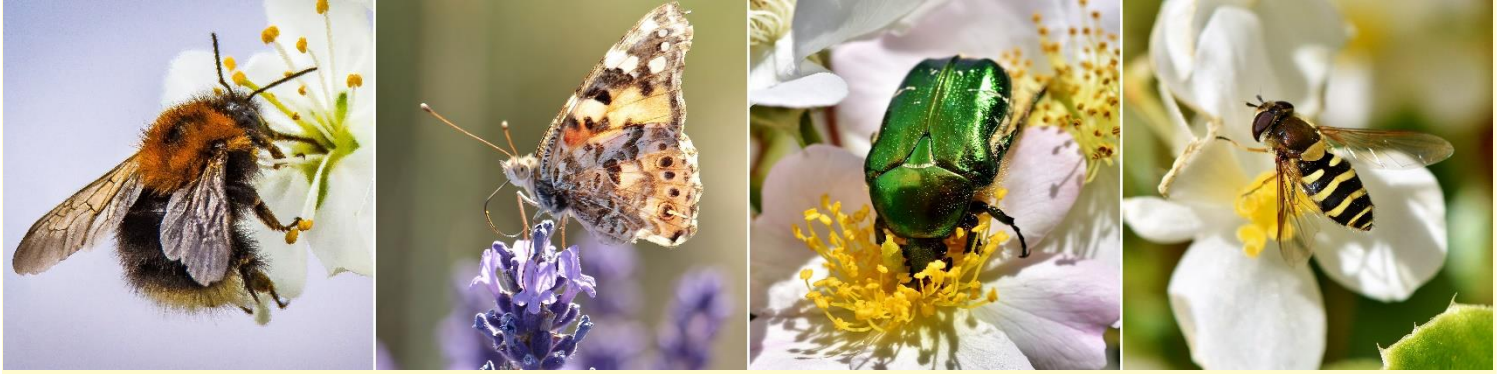
Prominente Nützlige: Hummel, Schmetterling, Rosenkäfer und Schwebefliege.