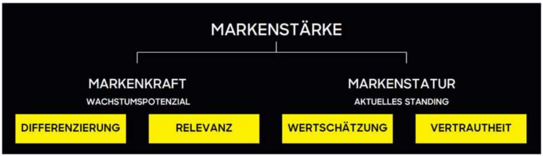
Dachmarke | Steiermark