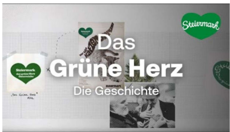
Dachmarke | Steiermark