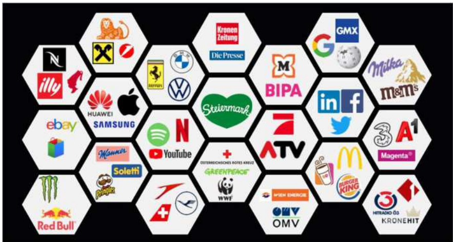
Dachmarke | Steiermark