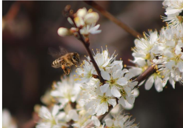
Honigbiene auf Schlehenblüte

Im Naturpark Geschriebenstein-Írottkő ist das Thema Naturschutz und Artenvielfalt ein wesentlicher Teil der vielfältigen Aufgaben. Um das Bewusstsein über die Wichtigkeit von Insekten und vor allem der Biene und des Bienensterbens zu stärken, wird dieses Jahr (2021) in Zusammenarbeit mit dem Bienenzuchtverein Lockenhaus ein Bienenlehrpfad errichtet sowie ein Bienenschaukasten in der Naturpark-Gemeinde Lockenhaus aufgestellt.