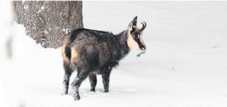
Tierspuren: F. Huber