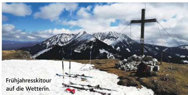
Frühjahresskitour auf die Wetterin.