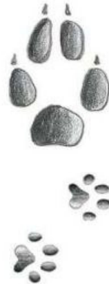
Tierspuren: F. Huber

Seit 2014 durchstreift Luchs „Karo“ die Wälder des Gesäuses.