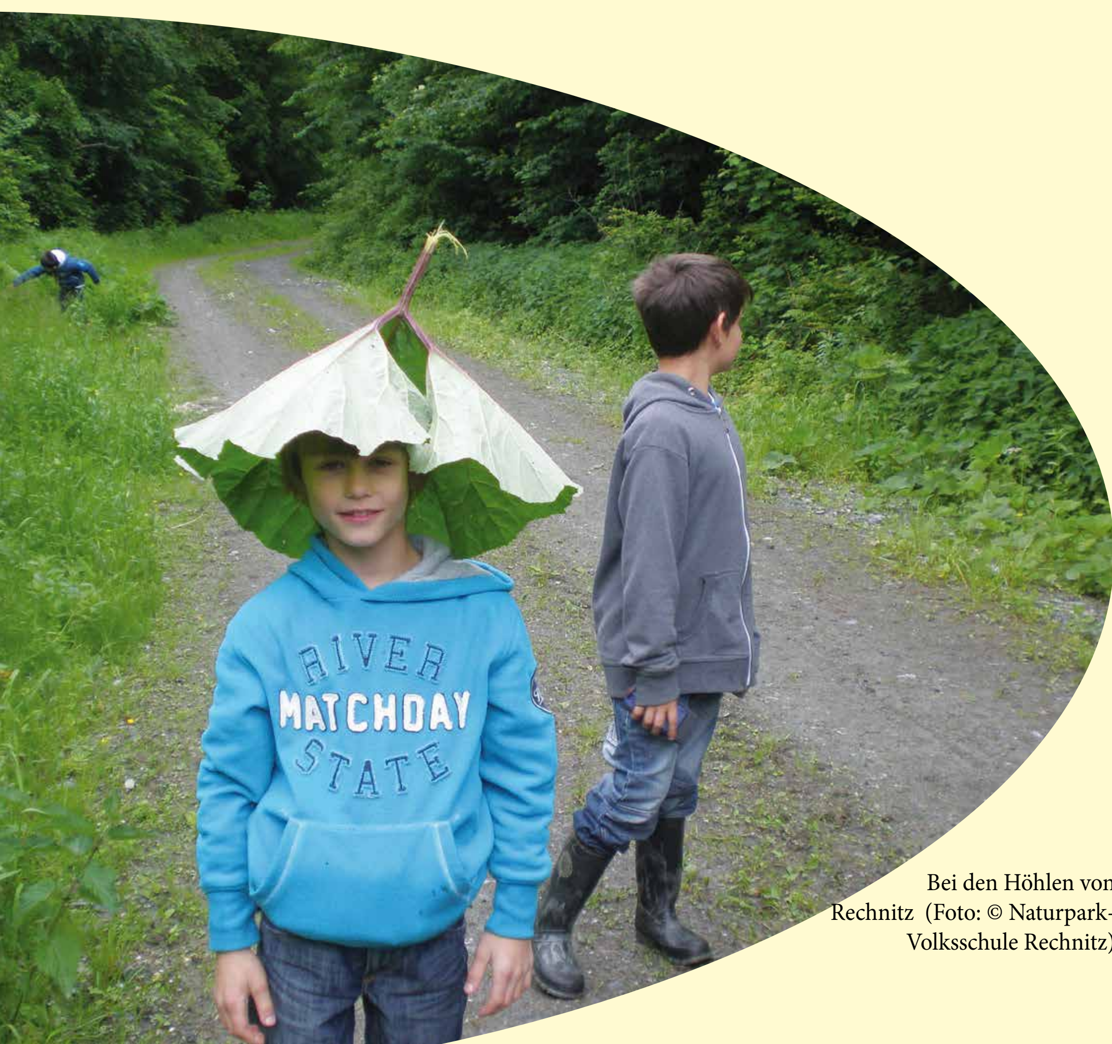
Bei den Höhlen von Rechnitz