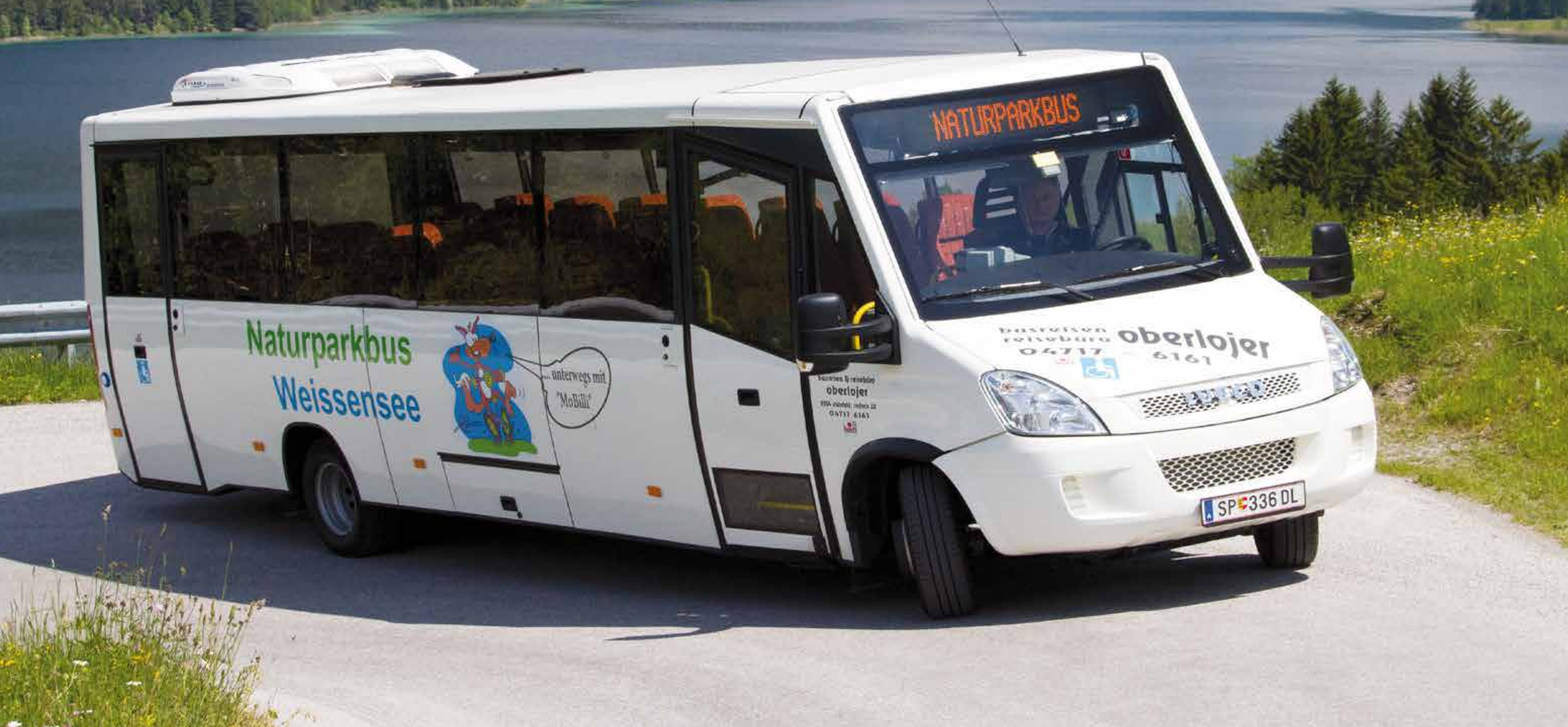
Naturparkbus Weissensee