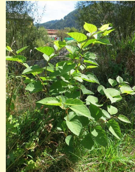
Japanischer Staudenknöterich und Sachalin- Staudenknöterich ( Fallopia japonica und F. sachalinensis )