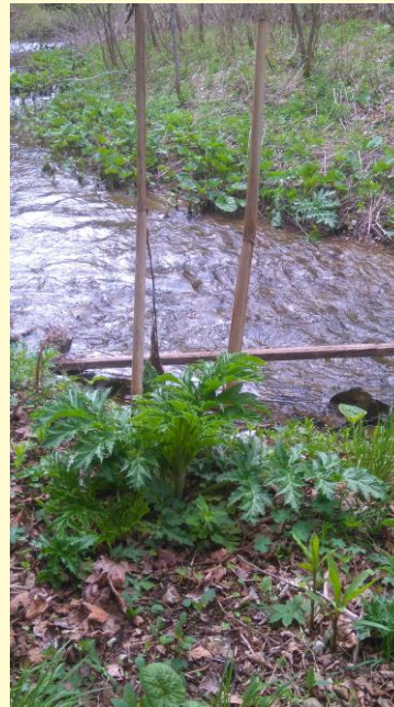
Riesen-Bärenklau ( Heracleum mantegazzianum )