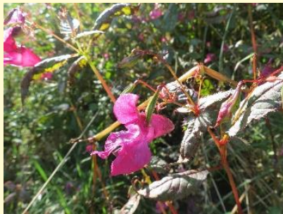
Drüsen-Springkraut ( Impatiens glandulifera )