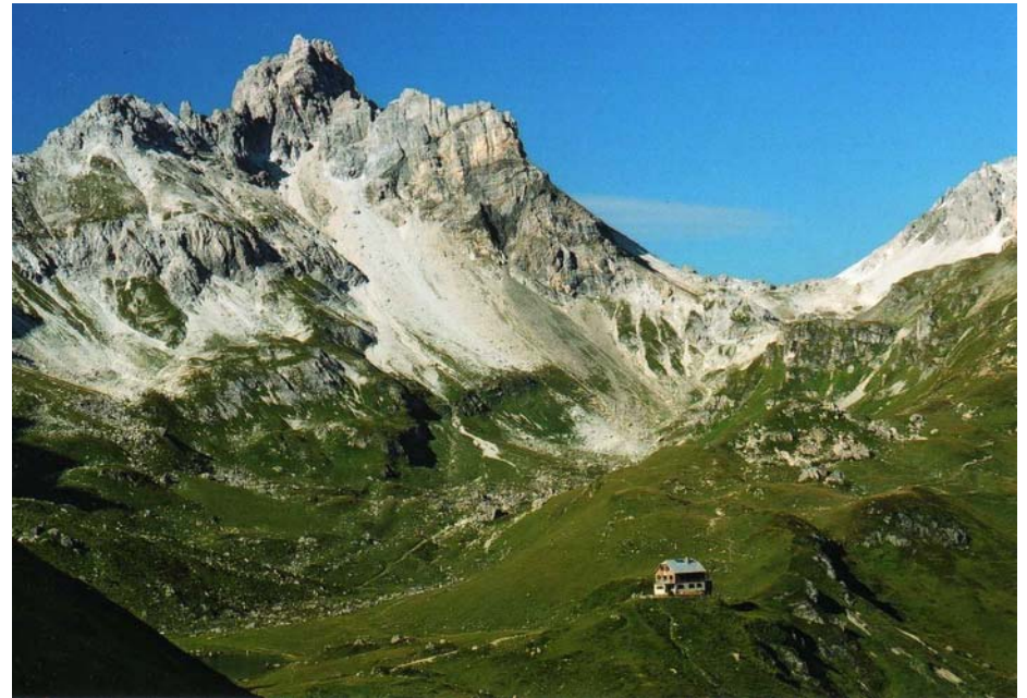
Franz Fischer Hütte mit Faulkogel