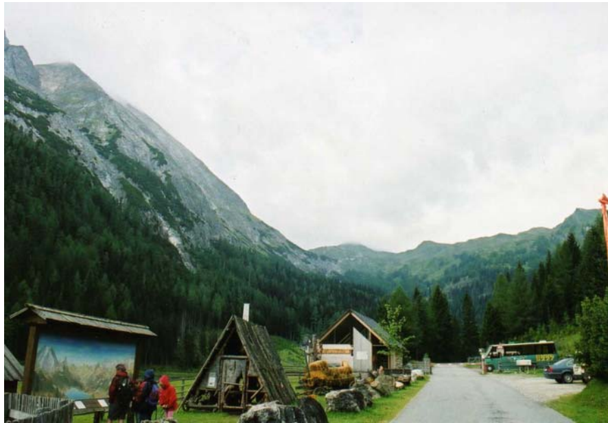
Naturparkhaus (mit grünem Tälerbus rechts)

Die Tälerbus-Betriebszeiten wurden in Abstimmung zum Postautodienst von 8-18 Uhr festgelegt. Bis zu vier Mal täglich gibt es eine Postbusverbindung zwischen Tamsweg und der Schliereralm, dem Startpunkt des stündlichen Tälerbusses. Das Fahrverbot Schliereralm-Königalm gilt nur während dieses Zeitraumes. Vor- und nachher darf wie bisher mit PKW ins Tal gefahren werden, wofür die Parkmöglichkeiten von seinerzeit leicht ausreichen. Die Talauswärtsfahrt ist jederzeit möglich.