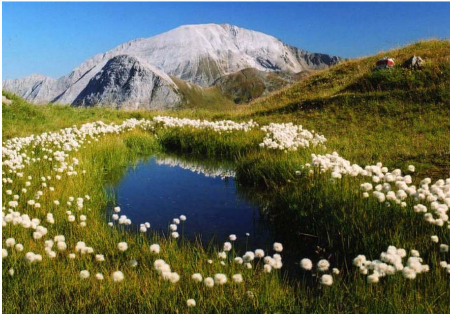
Weißeck 2711 m