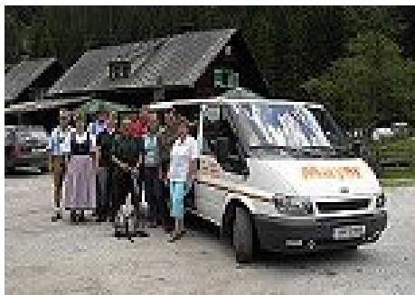
Der Talerbus der Fa. Mayer