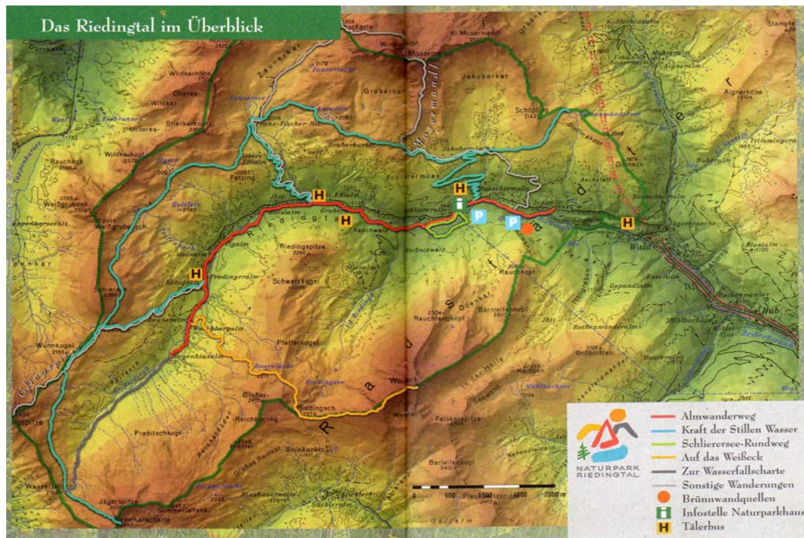
Karte des Riedingtales (mit Talerbus-Haltestellen)

Der Naturpark Riedingtal liegt im Bundesland Salzburg, genauer gesagt im Lungau in der Gemeinde Zederhaus, und umfasst eine Fläche von rund 36 km 2 . Er wurde 2003 gegründet.