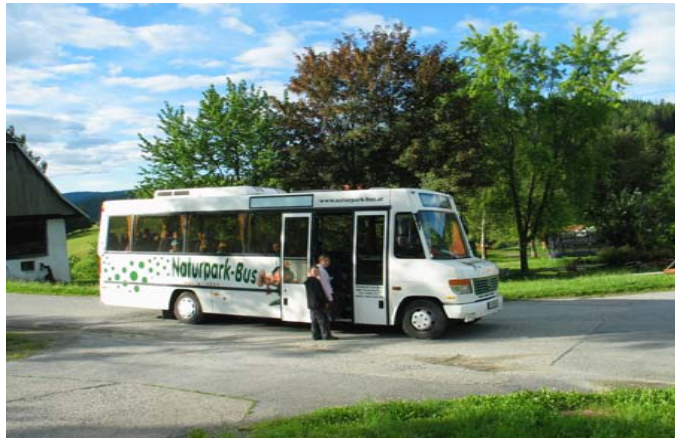
Naturpark-Bus aus der Flotte der Fa. Lercher