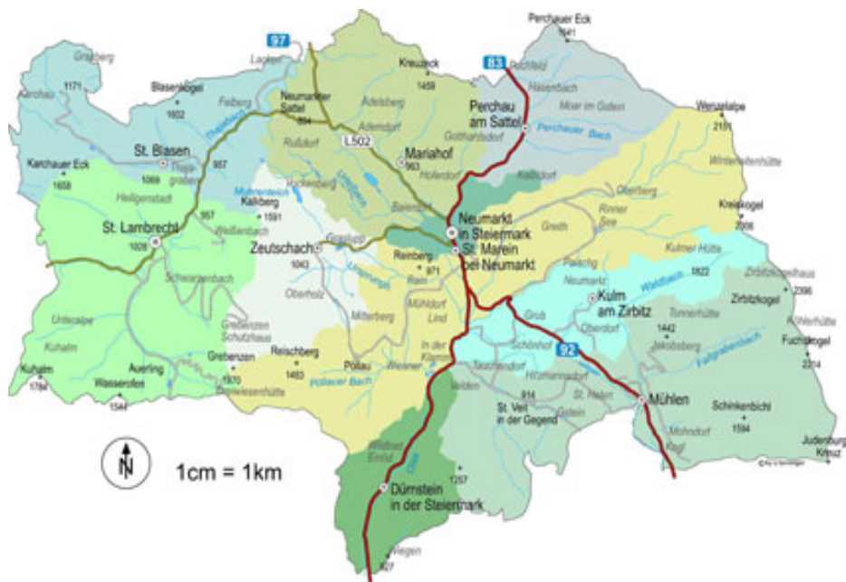
Übersicht über den Naturpark