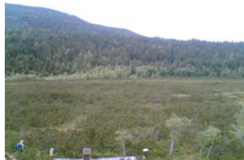
Im Dürnberger Moor