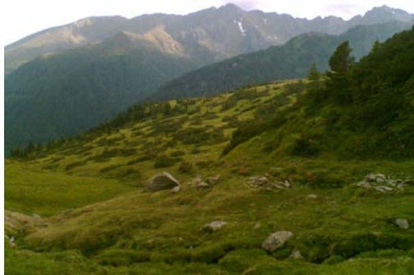
Auf dem Sölckpass