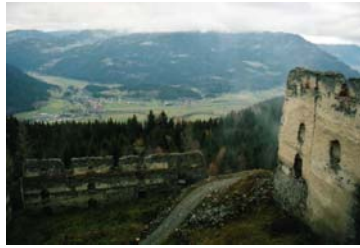
Ausblick vom Steinschloss auf Niederwölz