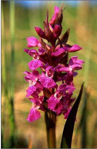
Fahrtziel Natur, 26.03.2010