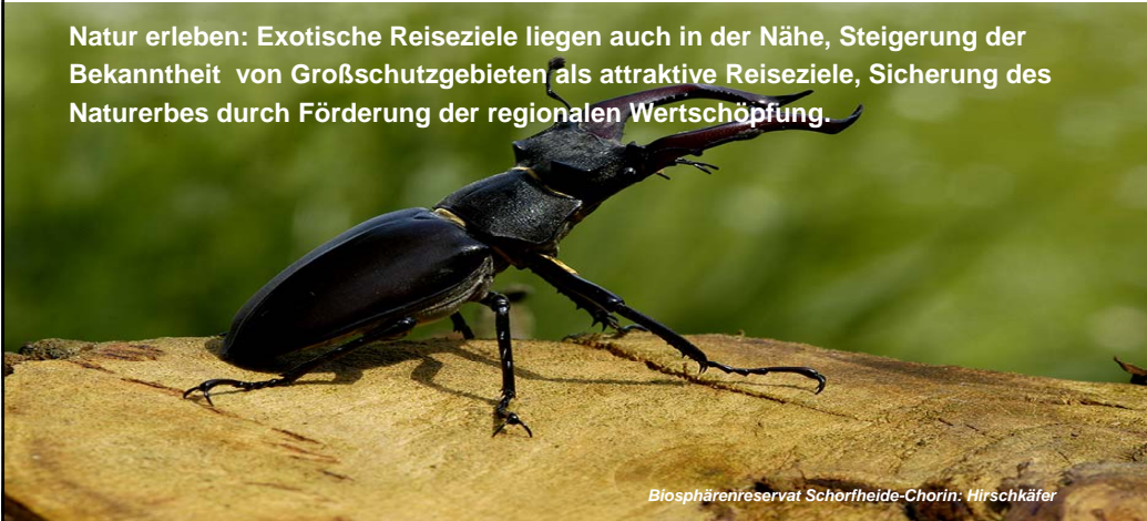
Biosphärenreservat Schorfheide-Chorin: Hirschkäfer

Natur erleben: Exotische Reiseziele liegen auch in der Nähe, Steigerung der Bekanntheit von Großschutzgebieten als attraktive Reiseziele, Sicherung des Naturerbes durch Förderung der regionalen Wertschöpfung.