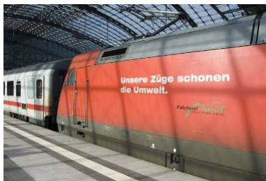
Fahrtziel Natur, 26.03.2010

Gebietsplakate machen an Bahnhöfen und in den Regionen auf die Kooperation aufmerksam