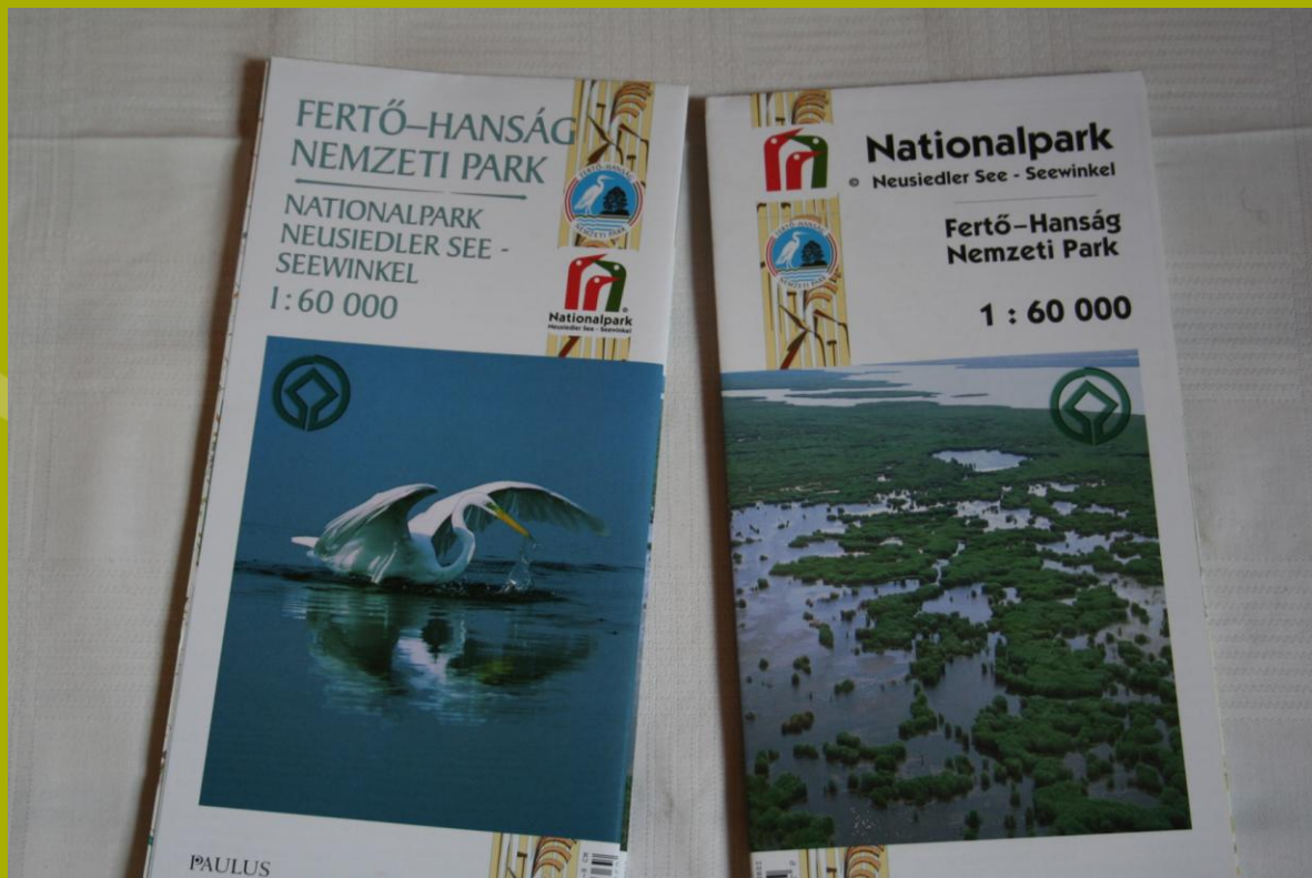
A két nemzeti park turisztikai térképe